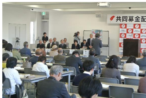
共同募金配分交付式

配分が決定した130施設・団体の代表者に対し、本会会長より配分決定通知書を交付した。