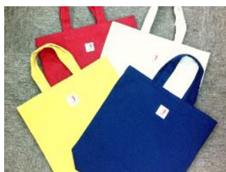
「うさピー」バック (倉敷市共同募金委員製作)

市町村共同募金委員会担当で構成する「共同募金運動資材検討会」の開催などにより、新たな募金グッズを企画・製作し、職域募金の増額及び新たな寄付者の開拓に努めた。