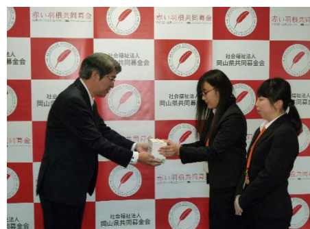
実行委員会より募金の贈呈