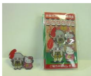
でんちゅうくん×キティちゃん コラボピンバッジ (井原市共同募金委員会製作)