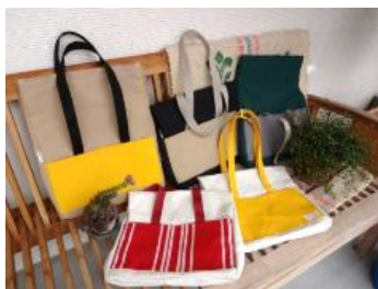
オリジナル帆布バッグ (津山市共同募金委員会製作)