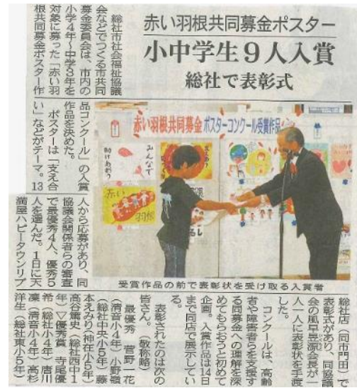
赤い羽根共同募金ポスター 作品コンクール (総社市共同募金委員会)