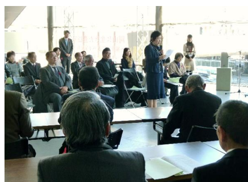
NHK歳末たすけあい配分交付式

配分が決定した27施設・団体の代表者に対し、本会会長より配分決定通知書を交付した。