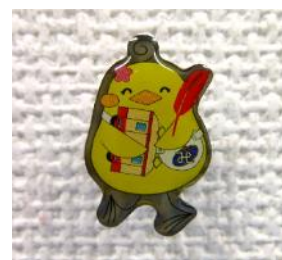
「みしゃモン」バッジ (美咲町共同募金委員会製作)