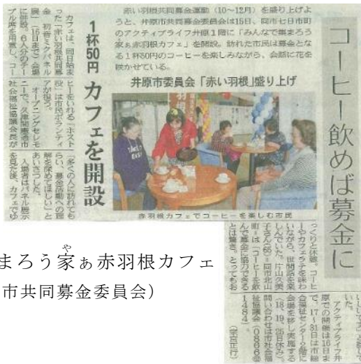
みんなで集まろう家あ赤羽根カフェ (井原市共同募金委員会)