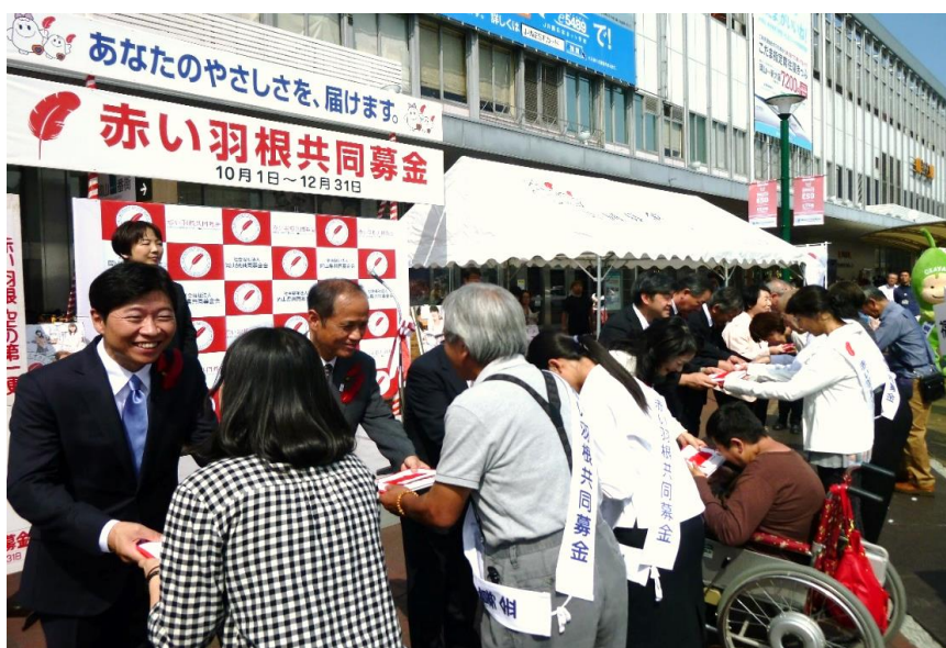
来賓から募金ボランティア代表者への募金箱・赤い羽根の伝達風景