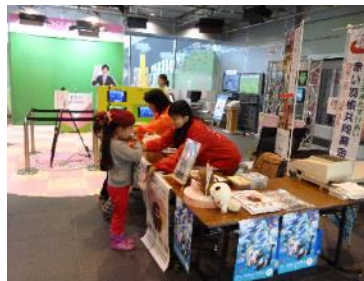
NHK歳末たすけあいの初日、市内幼稚園園児からの募金を受け取った。

なお、配分にあたり、12月19日、NHK岡山放送局に隣接した「ひかりの広場」にて配分交付式を実施した。