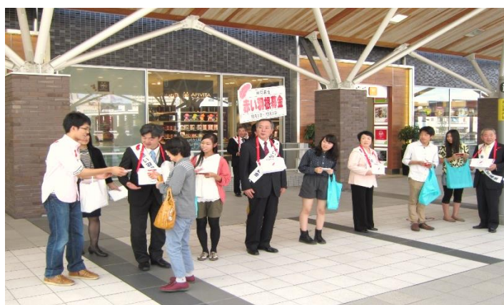
セレモニー終了後の街頭募金風景