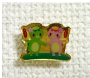
キャラクターピンズバッジ (津山市共同募金委員会製作)