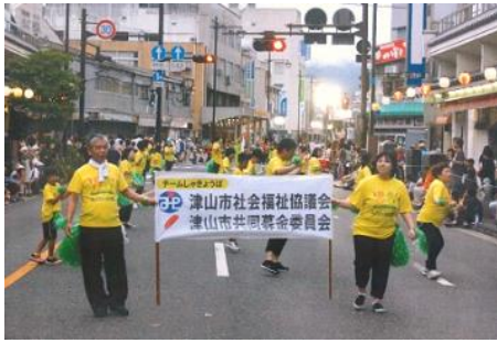
津山納涼ごんごまつり (津山市共同募金委員会)