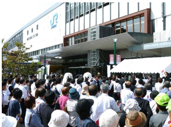
セレモニー会場の様子