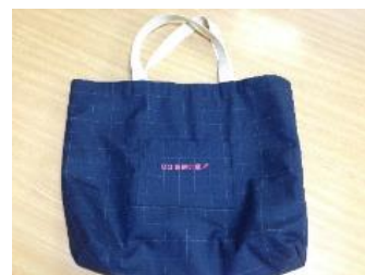
QQお助け袋 (美咲町共同募金委員会製作)