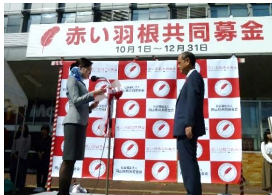
赤い羽根空の第一便