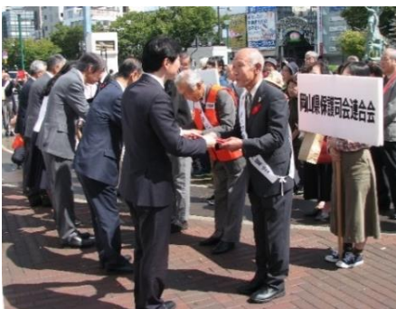
赤い羽根・募金箱の伝達

セレモニー後の街頭募金には、岡山県知事、岡山市長、岡山県共同募金会副会長、岡山市共同募金委員会会長をはじめ、県・市幹部職員、福祉関係団体職員、ANAグループ客室乗務員、募金ボランティアなど多くの参加を得て、岡山駅前周辺においてさわやかに通行人へ募金協力を呼びかけた。