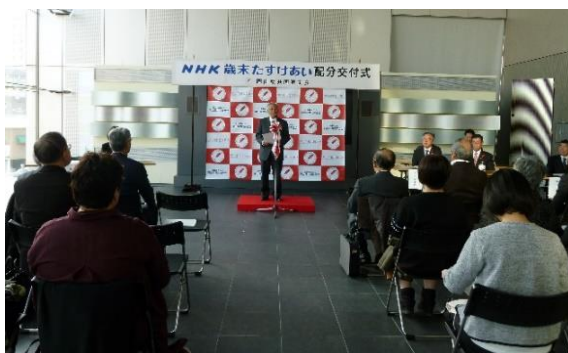
NHK歳末たすけあい配分交付式

なお、12月19日、NHK岡山放送局に隣接のひかりの広場にて配分交付式を実施した。