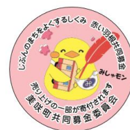
みしゃモンシール