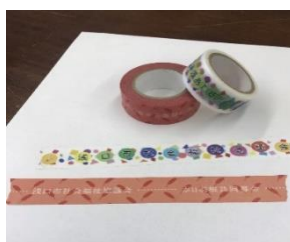
マスキングテープ