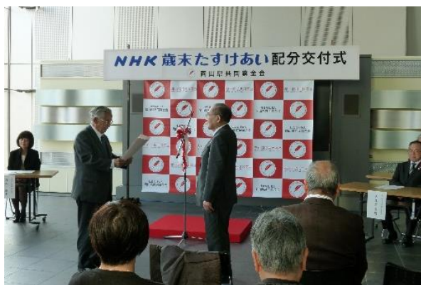
NHK歳末たすけあい配分交付式