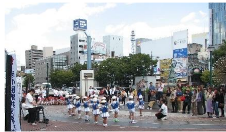
保育園児による鼓隊演奏