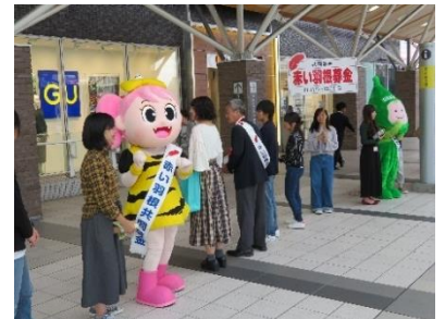
セレモニー終了後の街頭募金風景