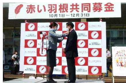
赤い羽根空の第一便