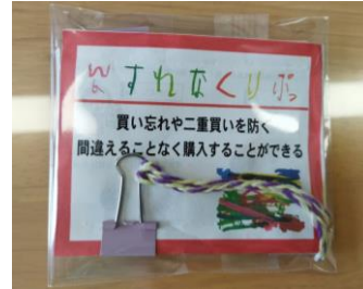
わすれなクリップ