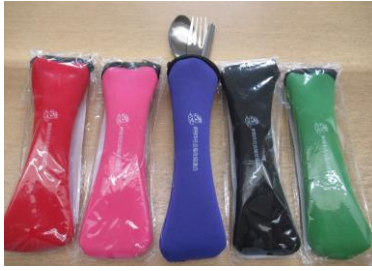
トリオカトラリー (新見市共同募金委員会)