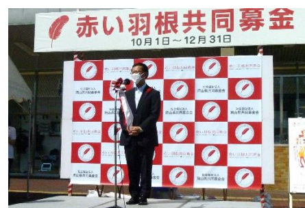
激励のことば（竹中副市長）