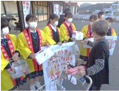
赤磐市共同募金委員会