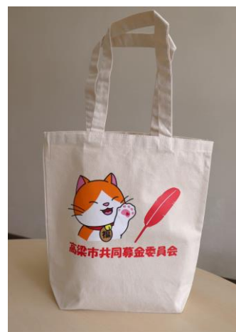
「ふくにゃん」のトートバック (高梁市共同募金委員会)