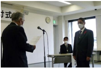
共同募金配分交付式