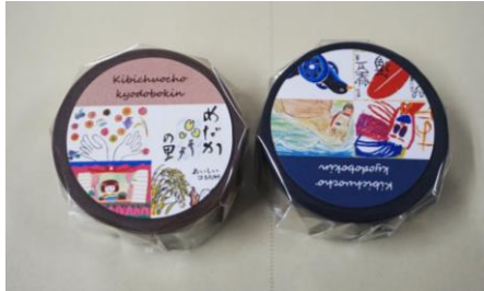
マスキングテープ (吉備中央町共同募金委員会)