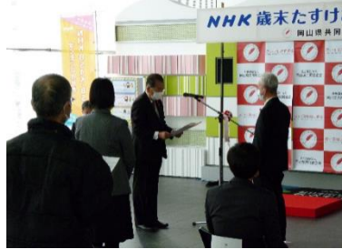
NHK歳末たすけあい配分交付式