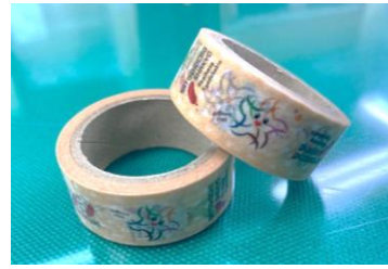
マスキングテープ (里庄町共同募金委員会)