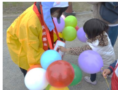
真庭市共同募金委員会