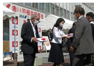
赤い羽根・募金箱の伝達