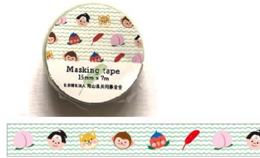
マスキングテープ