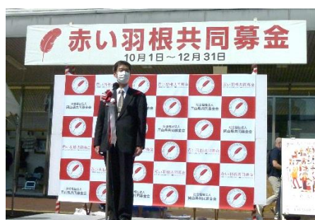
激励のことば（小谷副知事）