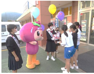
新見市共同募金委員会