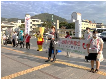
笠岡市共同募金委員会

県下市町村においても、新型コロナウイルス感染対策を行いながら、街頭募金活動を行った。